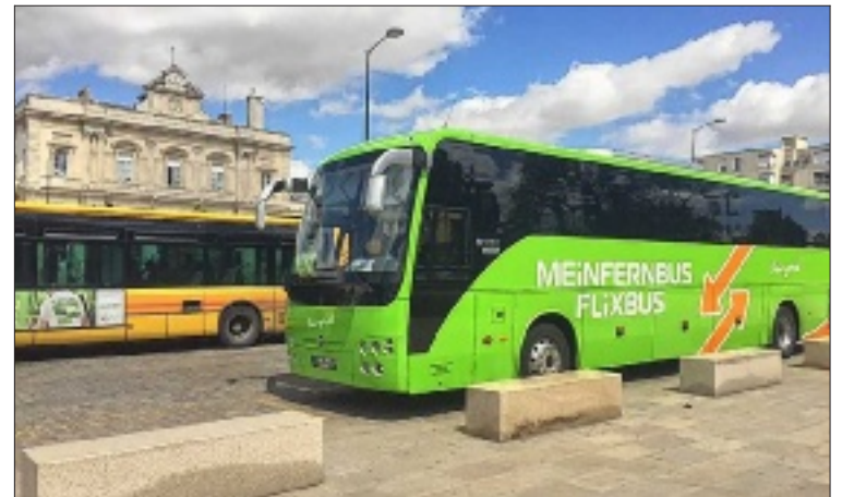
FlixBus propose depuis juin deux trajets quotidiens depuis Reims vers Francfort.