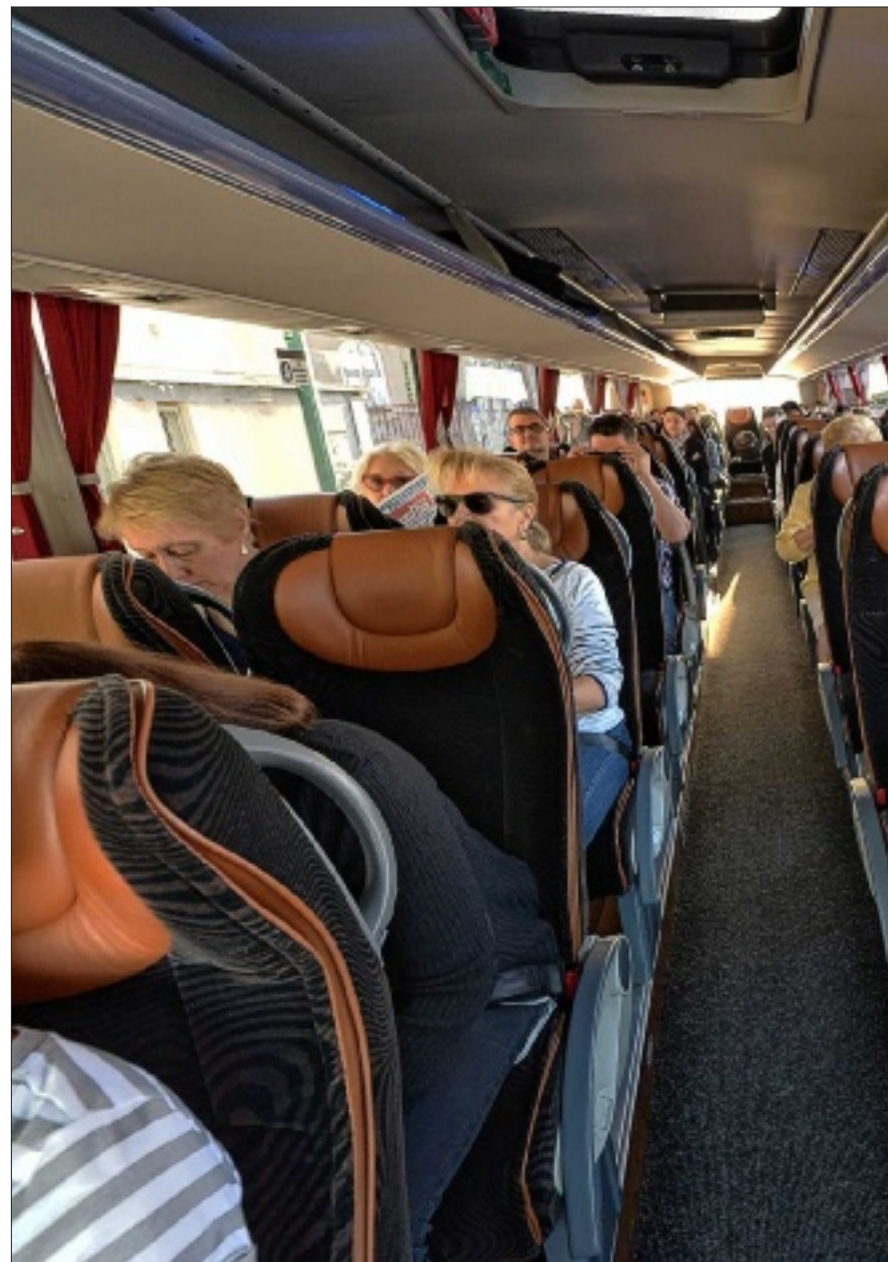
Mercredi dernier, ils étaient une quarantaine à emprunter l'autocar Reims Paris shopping, pour un